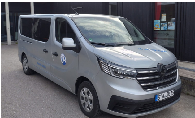
Unser neuer KJR-Bus im Verleih (ein Foto aus 2026)

Anfang Januar 2026 gab es bei einer Skiausfahrt nach Österreich einen kapitalen Turbo- und Motorschaden. Bei der Sichtung des Zustands stellte sich zusätzlich erneut heraus, dass die Bremsanlage erneut großteils erneuerungswürdig wäre. Glück im Unglück – ein Fremdschaden (Blechscha- den) und ein Hagelschaden waren noch nicht reguliert. Diese beiden Entschädigungen und ein glücklicher Verkaufserlös des Schadensfahrzeugs haben die Verluste noch etwas abgemildert.